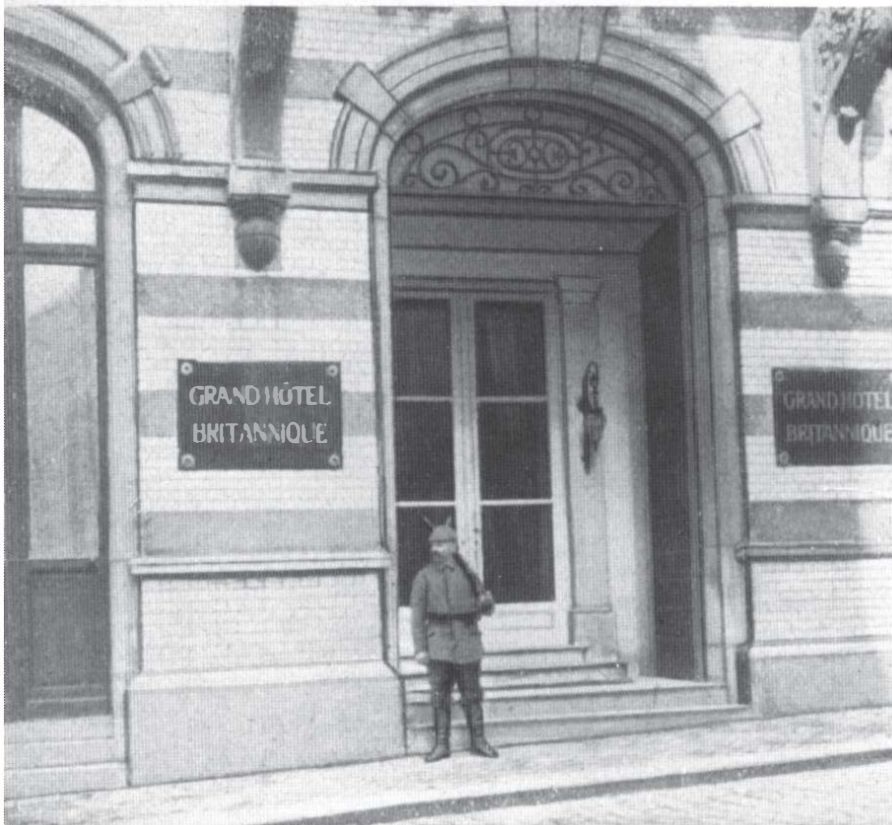
Hotel Britannique in Spa. Sitz des Großen Generalstabes 1918