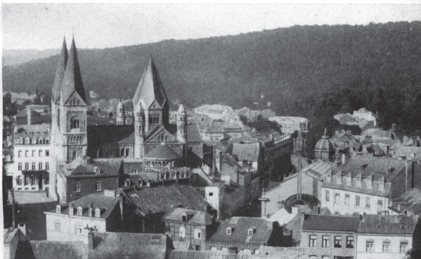
Spa in Belgien. Großes Hauptquartier 1918