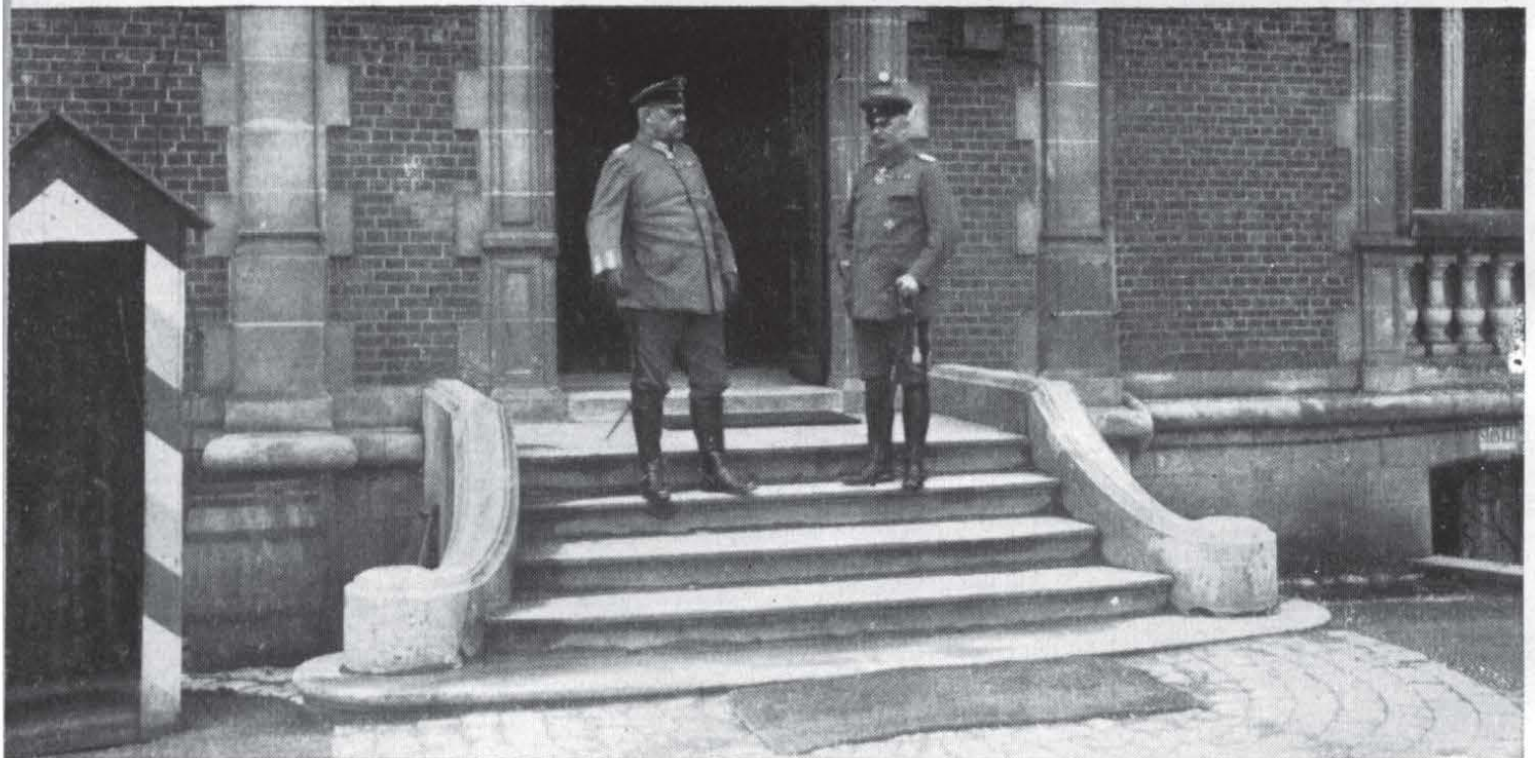
Hindenburg und Ludendorff vor dem Haus der Operationsabteilung in Avesnes. Sommer 1918