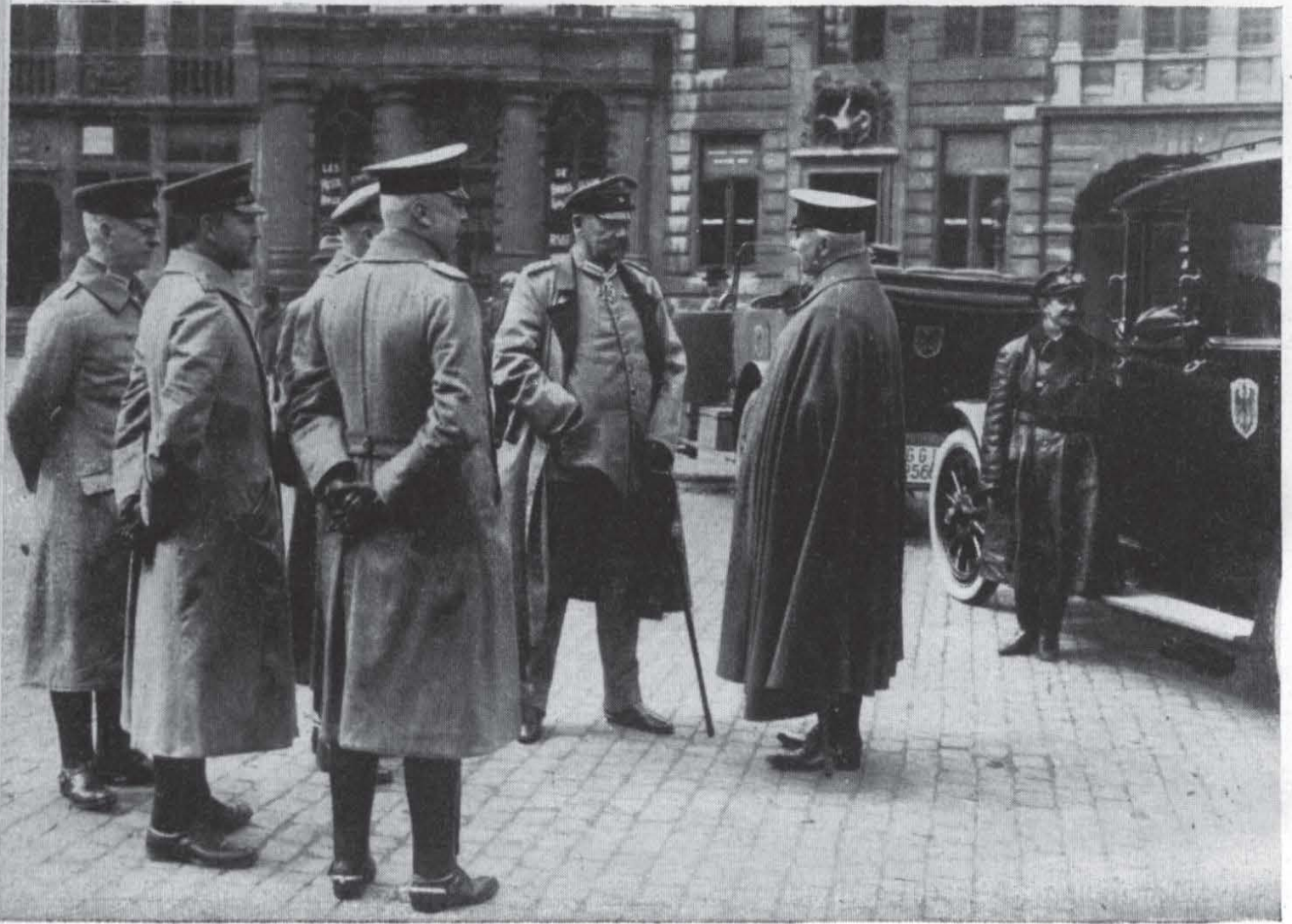
Hindenburg und Ludendorff auf dem Marktplatz in Brüssel