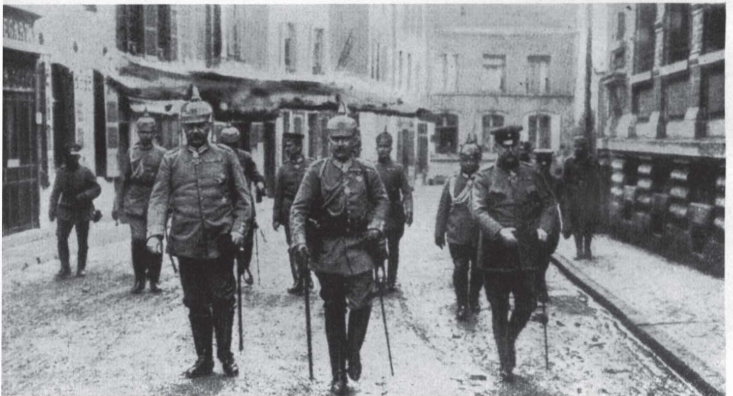
Die Oberste Heeresleitung während der großen Offensive März—April 1918 in Avesnes