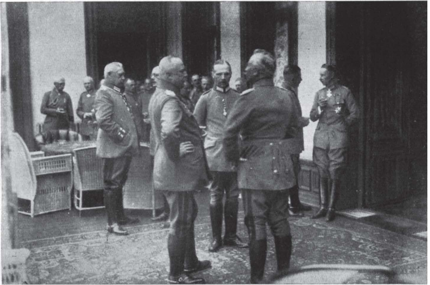
Ludendorff im Gespräch mit Kaiser Wilhelm am Tage des 30 jähr. Regierungsjubiläums des Kaisers, 15. 6. 1918