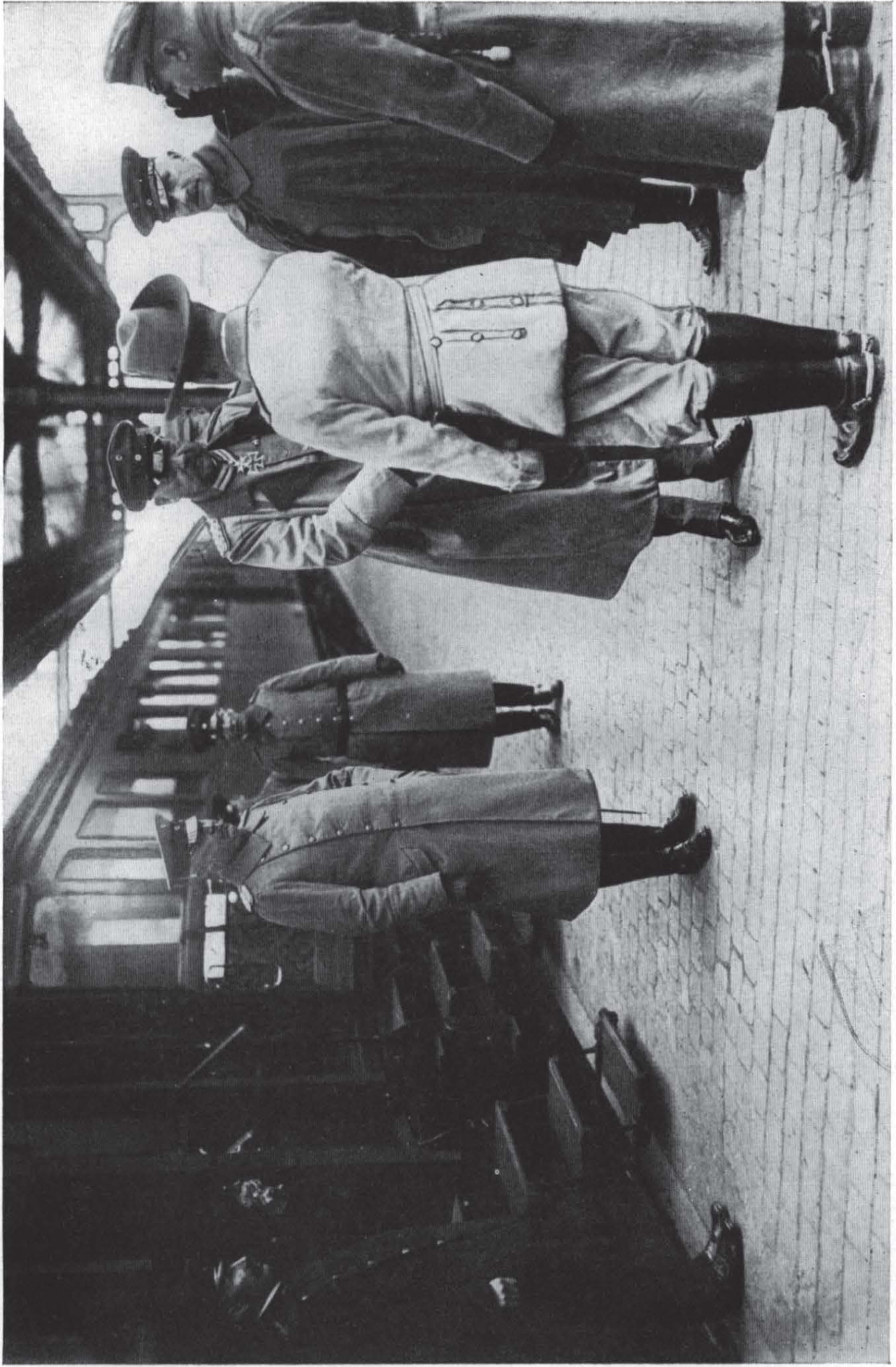
Hindenburg und Ludendorff entsteigen dem Sonderzug und begrüßen auf dem Brüsseler Hauptbahnhof Offiziere