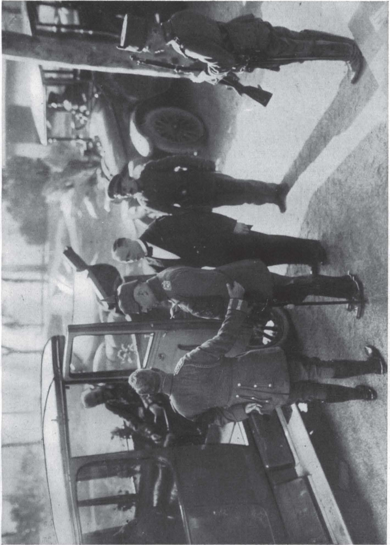
Der Kaiser verabschiedet sich von Ludendorff nach dem Frühstück beim Kaiser anlässlich des 70. Geburtstages Hindenburgs