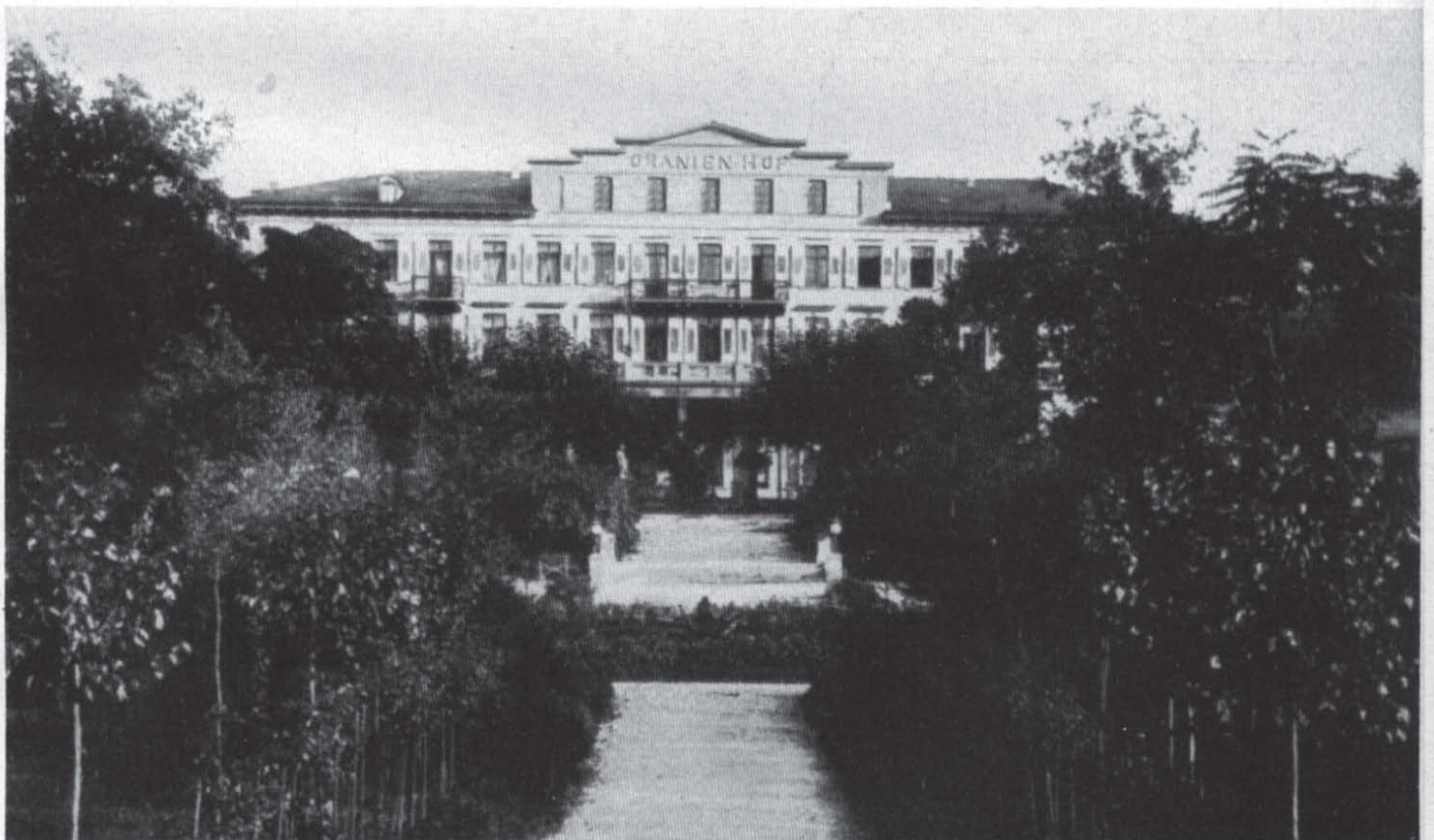
Der Dranienhof in Bad Kreuznach. Großer Generalstab vom Januar 1917 bis Februar 1918