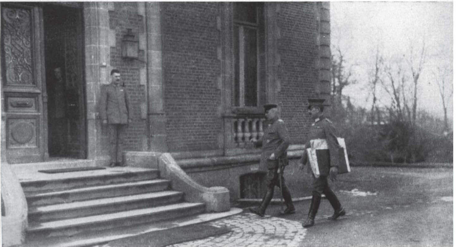
Ludendorff mit Oberstlt. Wegell auf dem Wege zum Vortrag beim Kaiser. Avesnes, Frühjahrsoffensive 1918