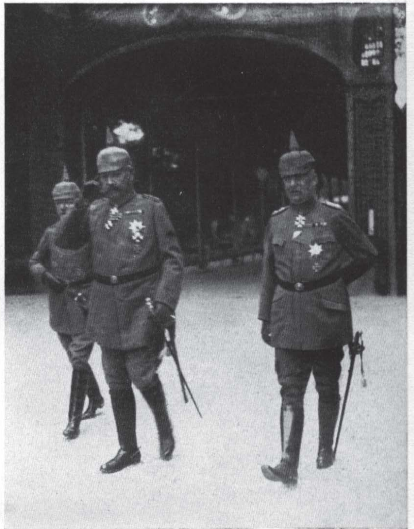
Hindenburg und Ludendorff begeben sich zur Begrüßung des Zaren Ferdinand