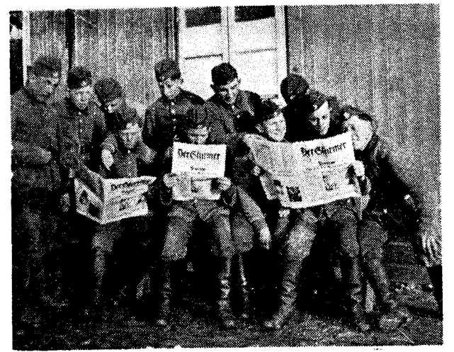
Auch im Arbeitsdienstlager Aholzing b./Straubing 5/294 hat der Stürmer seinen Einzug gehalten

„Die getauften Juden bleiben auch nach jüdischer Auffassung Juden, weil das Judentum den Glaubenswechsel nie anerkennt und den getauften Juden nach wie vor als Juden betrachtet.“