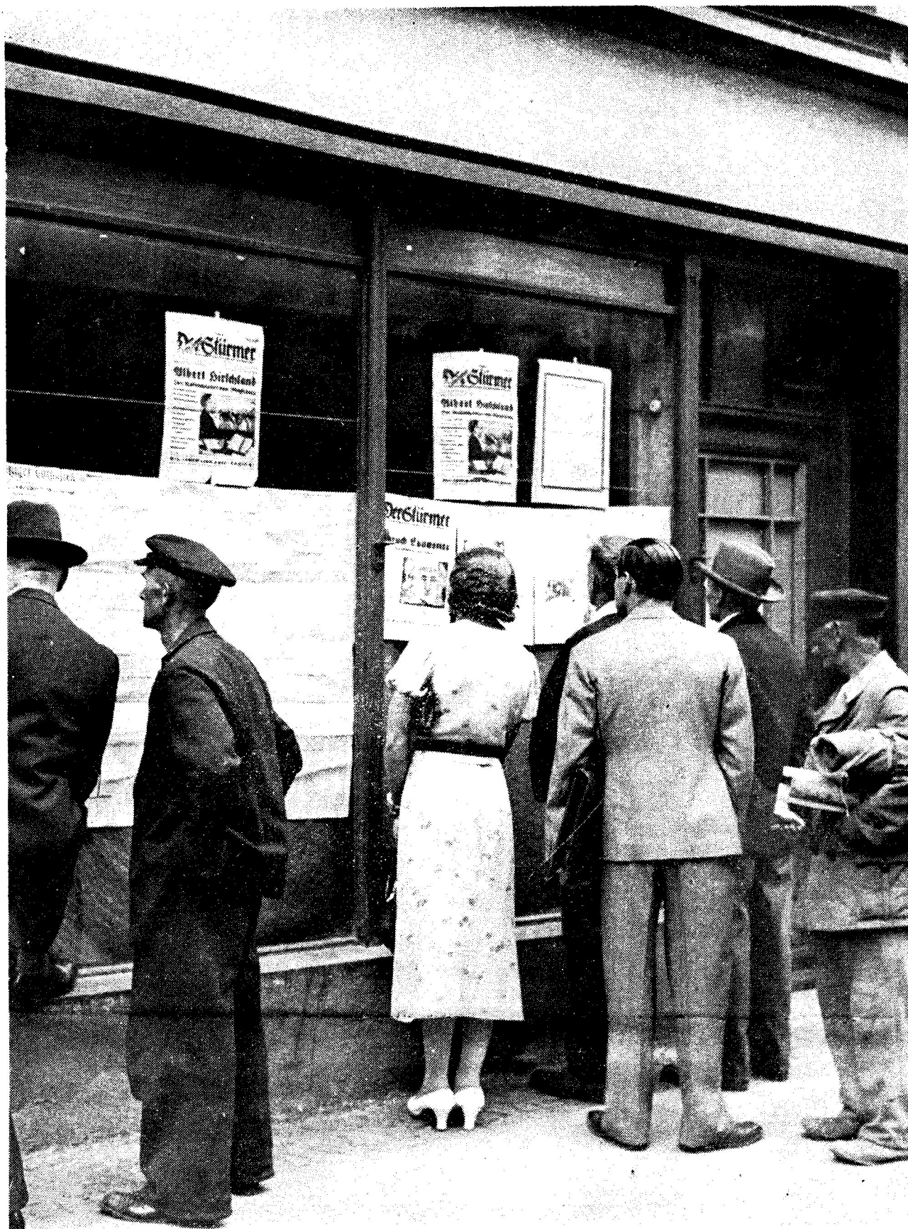
Aufnahme Wittner (Mäschke)