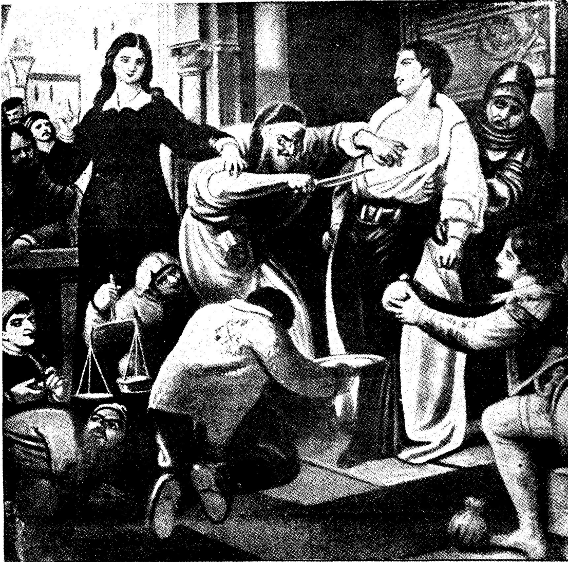
Shylock Demanding His Pound of Flesh While Portia Pleads for Mercy.—From the Painting by the European Artist, V. A. Bruckmann.

Schließlich kam für diesen Menschenfreund selbst einmal eine gewisse Zeit, wo er sich in Geldverlegenheit befand. Das war nun für den Juden Shylock eine günstige Gelegenheit, mit ihm einen Vertrag abzuschließen, in welchem festgelegt worden ist, daß, wenn der Philantrop seine Schuld an Shylock am Verfalltag nicht in bar beglich, Shylock sich anstatt seines Geldes, aus dem Körper seines Schuldners, nahe dem Herzen seines Opfers, ein